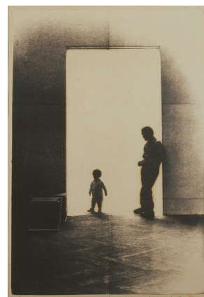
《日記 1976年8月19日》 柏わたくし美術館所蔵

会期 2007年1月11日（木）～1月28日（日） 開館時間 10：00～17：00（入館は16：30まで） 休館日 毎週月曜日 会場 東京藝術大学大学美術館 地下2階展示室 入場料 無料 主催 東京藝術大学美術学部 東京藝術大学大学美術館 問合せ 03-5777-8600（ハローダイヤル） http://www.geidai.ac.jp/museum/