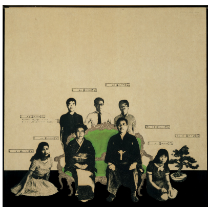
《日記 1968年8月22日》 東京藝術大学大学美術館所蔵

*本展は、2006年9月30日（土）～12月24日（日） CCGA 現代グラフィックアートセンターにおいて開催しています。