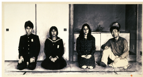
《日記 1987年5月30日、柏市亀甲台2-12-4》