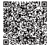
フォーム用QRコード

返信ハガキ/メール発送予定：2022年2月6日（日）＊応募多数の場合は抽選となりますので、あらかじめご了承ください。