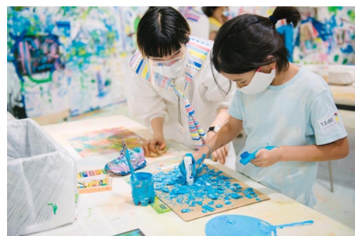
(c) 3331 Arts Chiyoda, photo by Yuka IKENOYA (YUKAI) アートワークショップ（イメージ）