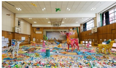
上、左：東京のまちを舞台に展開されたプロジェクトの様子