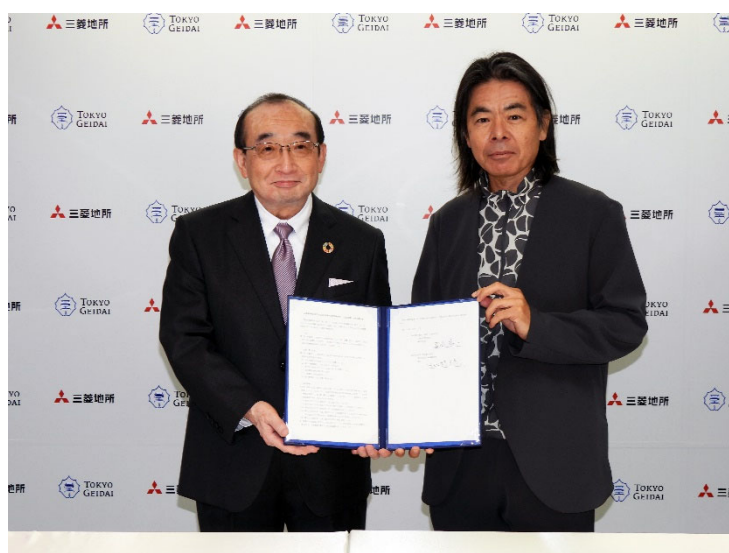
▲三菱地所 執行役社長 吉田淳一（左）と東京藝術大学 学長 日比野克彦（右）

東京藝術大学の主要拠点であり、多くの歴史・文化施設をもとに多様な文化が生み出されている上野から、三菱地所が「丸の内 NEXT ステージ」と位置付け“人・企業が集まり交わることで新たな「価値」を生み出す舞台”を目指して、まちづくりを推進する大丸有エリアまで、芸術の力を通じて、より一層魅力ある場として創造していくことを目指します。